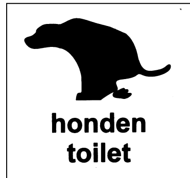
Figuur 1-2: voorbeeld van nieuwe bebording bij hondentoiletten