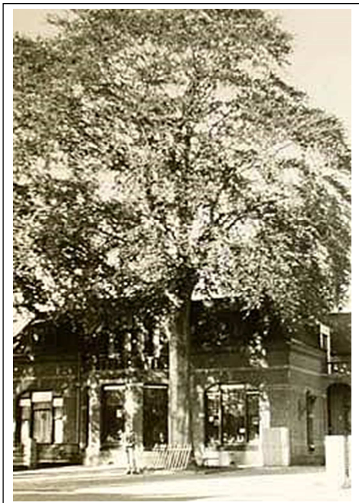
Foto van een oude beuk ( Fagus sylvatica ) in de Wilhelminastraat, opgenomen op de nationale monumentenlijst.

In hoofdstuk 2 wordt het huidige beleid, het doel en de aanpassingen middels deze update beschreven. In hoofdstuk 3 zijn de criteria en de manier van selecteren beschreven. Hoofdstuk 4 geeft een overzicht van de manieren waarop de gemeente Asten de bescherming van deze bomen regelt. In hoofdstuk 5 worden enkele aanbevelingen opgesomd. In de bijlagen worden alle beschermwaardige bomen beschreven en op kaart aangeduid.