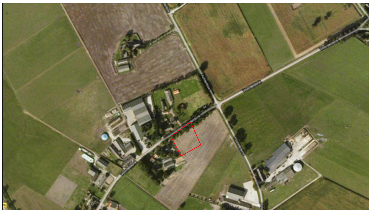
Figuur 1: Ligging plangebied aan de Voordeldonk (Google Earth, 2011).

Het plangebied ligt in het agrarisch gebied tussen de kern Asten en de A67, oostelijk van Asten. De nieuwbouw sluit aan op bestaande lintbebouwing aan de noordkant van de Voordeldonk (zie figuur 1). Het perceel waar de nieuwbouw gaat plaatsvinden is momenteel in gebruik als grasland/weide. Aan de zijde van de Voordeldonk is laanbeplanting aanwezig in de vorm van Zomereiken.