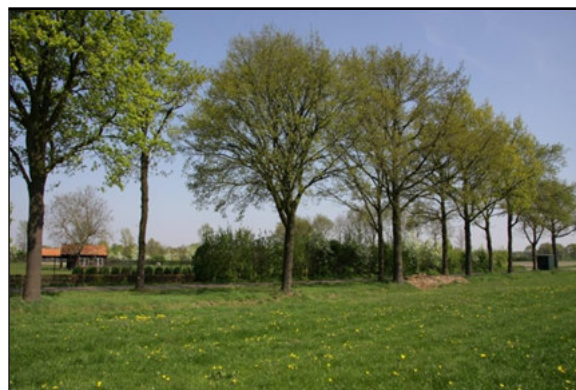
Figuur 3 en 4: Impressie van het plangebied. Foto rechts: laanbeplanting noordrand plangebied langs Voordeldonk.