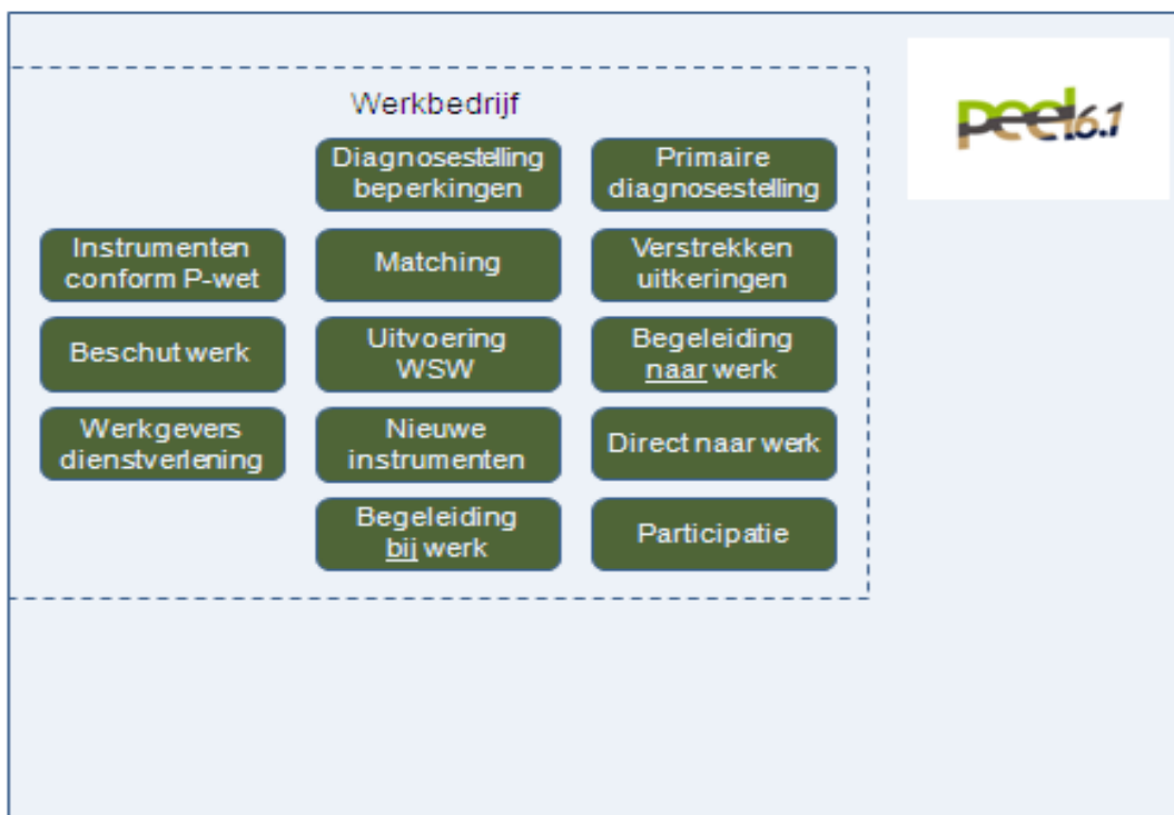
Figuur 2. Organisatiemodel Werkbedrijf Participatiewet

In het model in figuur 2 zijn alle functies samengebracht in 1 werkorganisatie die in principe onder verantwoordelijkheid van het bestuur Peel 6.1 de werkzaamheden gaat uitvoeren en deel gaat uitmaken van de Uitvoeringsorganisatie Peel 6.1.